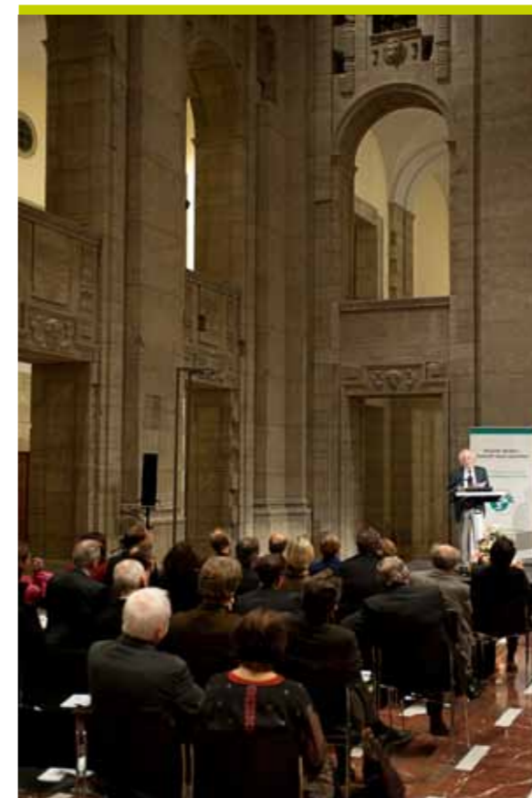
Bärensaal im Alten Stadthaus, Berlin

kungen die asymmetrischen Machtlagen in der Welt, so wie sie schon heute existieren bzw. wie sie sich in der Folge von Machtverschiebungen herausbilden werden, in den kommenden Jahrzehnten auf die Verwirklichungschancen von Global Governance in einzelnen Teilordnungen und ggf. hinsichtlich einer denkbaren Gesamtarchitektur haben werden: Wird es einen bipolaren Hegemonialkonflikt zwischen den USA und China geben? Werden sich diverse Clubformationen à la G-20 als politikbestimmend herausbilden? Oder wird vielmehr – positiv gewendet – Global Governance durch die Entwicklung von Regional Governance auf diversen Kontinenten und Subkontinenten gewissermaßen einen soliden Unterbau erhalten? Und welche Rolle wird im Übrigen das System der Vereinten Nationen einnehmen, ist dieses doch eigentlich völkerrechtlich und auch im Bewusstsein vieler Menschen prädestiniert, Global Governance institutionell zu verkörpern? Fragen über Fragen angesichts sich akzentuierender globaler Problemlagen, denen trotz der Zerklüftungen in der Welt durch problemadäquate Verregelungen entgegengewirkt werden muss. Wozu Nichtregulierung, der Abbau von leidlich bestehender Regulierung bzw. eine bewusst politisch angestrebte Deregulierung führt, wird durch die Weltfinanzmarktkrise in allen Teilen der Welt