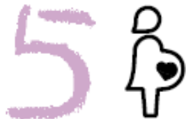
Muettergesund- heit verbessern