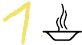
Armut & Hunger bekämpfen