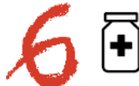
Übertragbare Krankheiten eindämmen