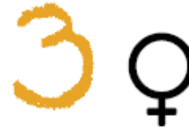
Gleichstellung der Geschlechter