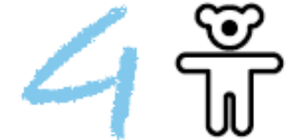
Kindersterblich- keit verringern