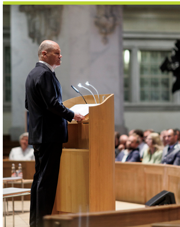
Olaf Scholz MdB bei seinem Impulsvortrag

Scholz formulierte zwei unverhandelbare Ziele, die die Menschheit noch in diesem Jahrhundert verwirklichen müsse: Erstens dürften Grenzen unter keinen Umständen mit Gewalt verschoben werden – egal in welcher Weltregion. Zweitens dürften nirgendwo auf der Welt politische Oppositionelle