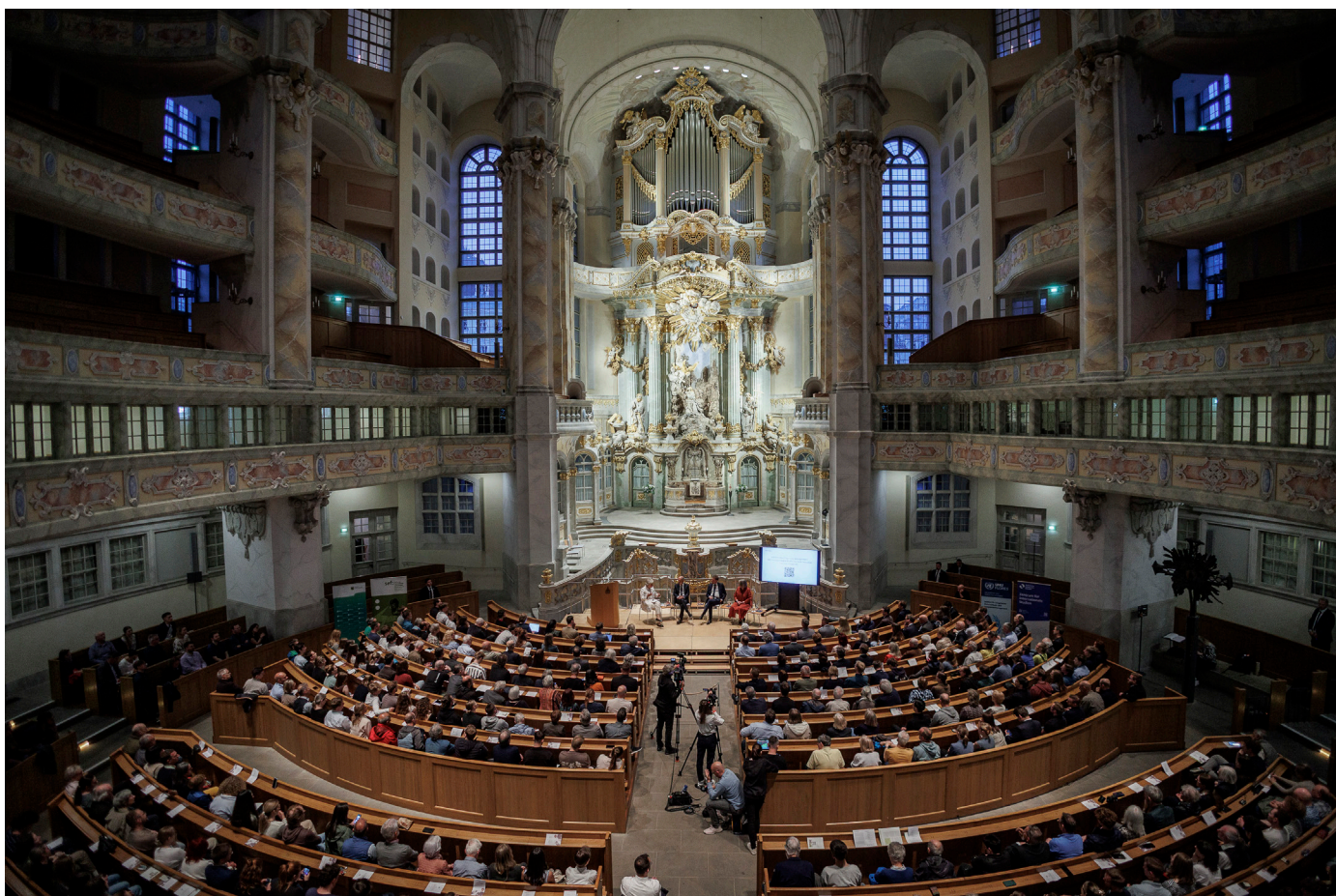
Die Dresdner Frauenkirche war mit über 680 Personen voll besetzt. Über das Online-Tool Slido hatten Zuschauende die Möglichkeit, ihre Fragen an das Panel einzureichen, von denen viele durch die Moderatorin Alexandra Gerlach zum Ende der Diskussion aufgegriffen wurden.

Unter Bezug auf Heike Kriegers Ausführungen zur Beharrlichkeit des Rechts zog er eine historische Parallele zur ostdeutschen Erfahrung: „Wir haben im Osten jahrzehntelang hinter der Mauer gehockt, aber nur weil man an der Hoffnung auf Freiheit und Recht festgehalten hat, konnte man nach 1989 daran anknüpfen.“ In Bezug auf die Ukraine bezog Kretschmer klar Position: „Kein Quadratmeter der Ukraine ist russisch geworden, rechtlich auch nicht auf der Krim. Putin darf den Krieg nicht gewinnen, die Ukraine darf nicht verlieren – aber dazwischen muss ja auch irgendetwas sein, eine Lösung für die Zukunft.“