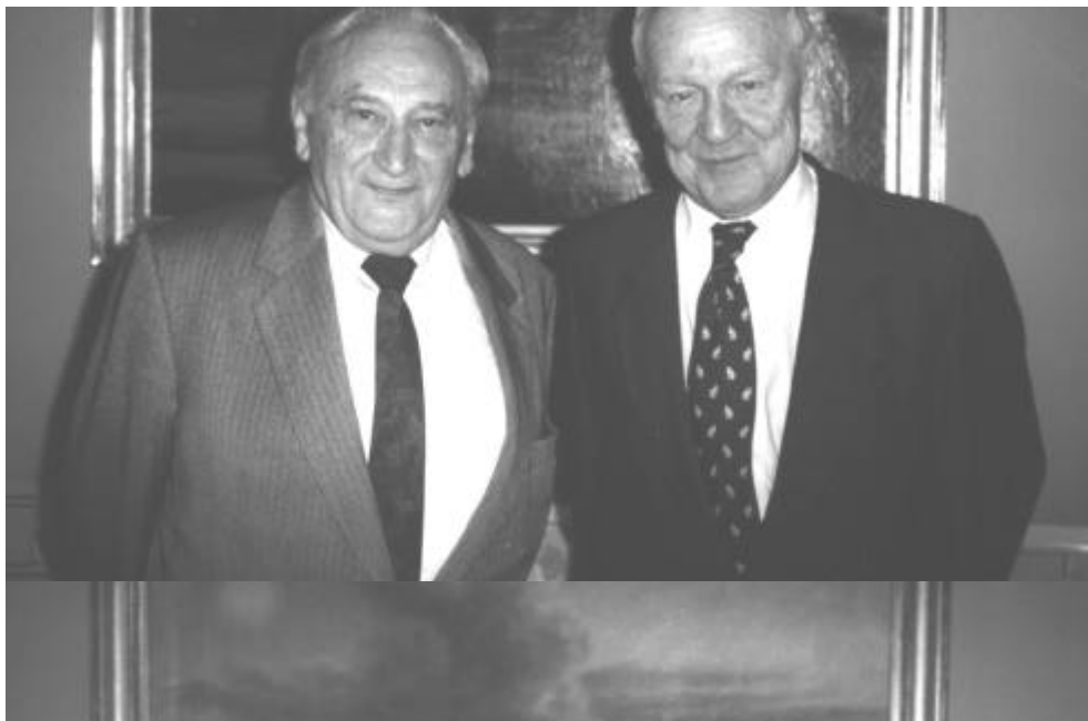
Egon Bahr und Mieczyslaw Rakowski, ehemaliger polnischer Ministerpräsident, beim Empfang im Schloss Lindstedt (Potsdamer SEF-Frühjahrgespräche 2002)

Die Potsdamer SEF-Frühjahrgespräche 2002 , die vom 18.-20. April 2002 stattfanden, wurden in enger Abstimmung mit Prof. Egon Bahr und den Kooperationspartnern WeltTrends, Potsdam, und Institut für internationale Beziehungen, Prag, geplant. Prof. Egon Bahr, Bundesminister a. D. und langjähriges Kuratoriumsmitglied der Stiftung, feierte kurz vor den Früh-